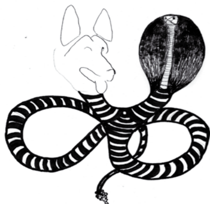
Une griffe et une canine dans un verre de Martini (dédié à VNS activity) par Marie