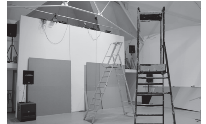
La Chaufferie aujourd'hui