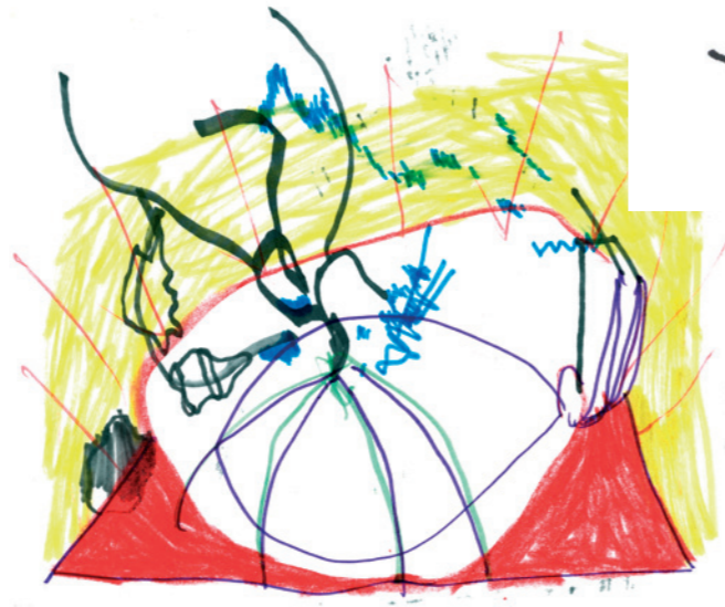
Gogito, par Gogito